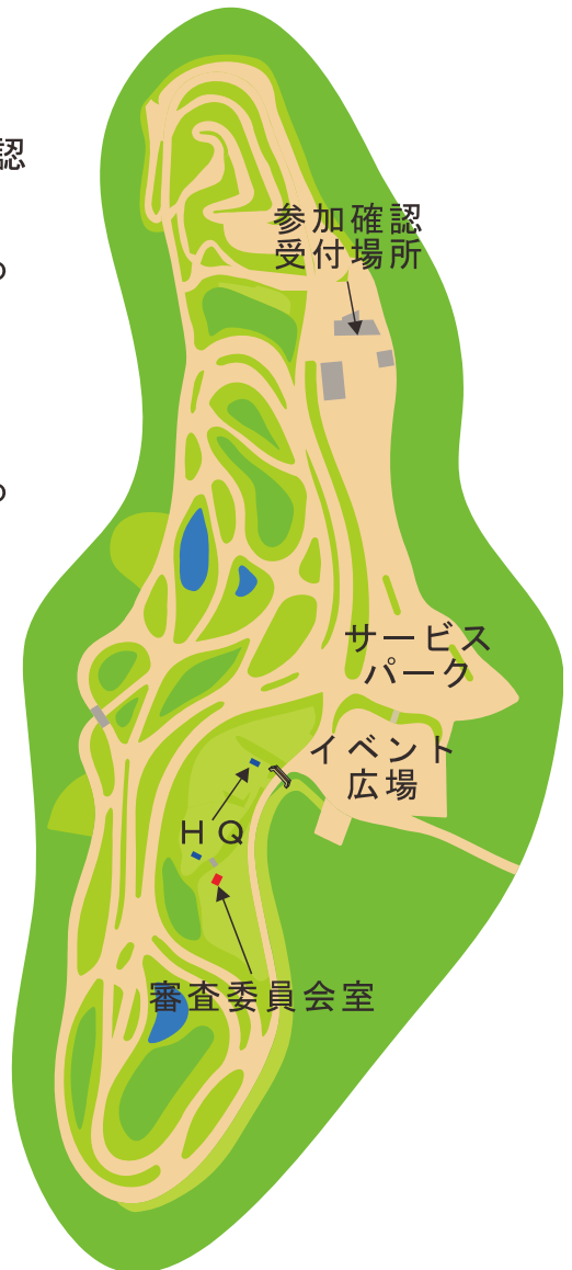
テクニクスステージタカタ 全体図